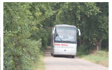
Eindelijk rijdt hij het zandpad op