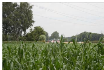
Ja hoor, in de verte zie je de bus